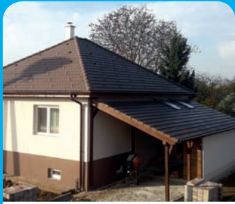
III. hely - ifj. Pápa Mihály, Nagyhalász