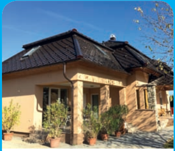
Szakmai különdíj - Farkas György, Dinnyés